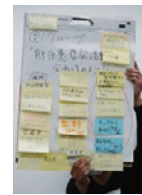
～ グループディスカッションの様子 ～